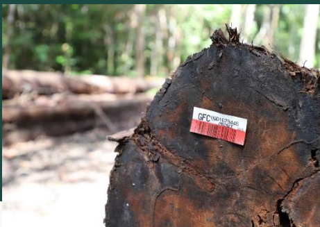
Système de traçabilité au Guyana