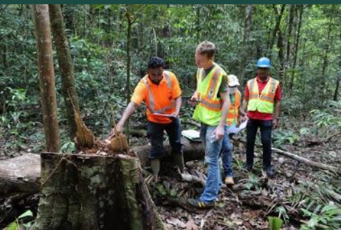
Mission de terrain au Guyana avec EFI