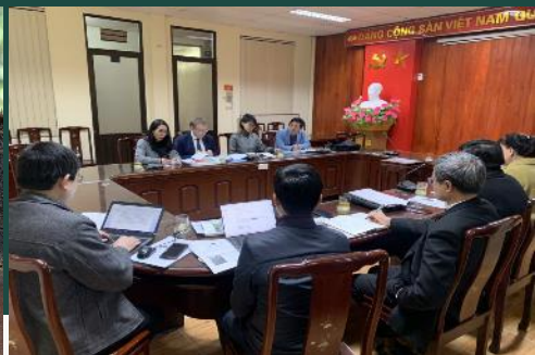
Réunion au Vietnam avec l'Administration forestière